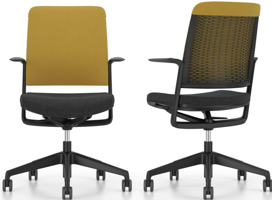
Rückenpolsterauflage aus 3D Runner Netzgewebe