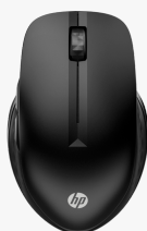
HP 430 Wireless-Maus für mehrere Geräte 3B4Q2AA