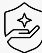
3 Jahre Abhol- und Lieferservice U4812E