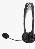
HP Stereo-Headset (3,5 mm) G2 428H6AA