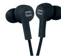
WASSERDICHTER KOPFHÖRER GEMÄSS IPX4