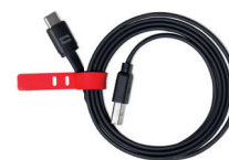
USB-A / USB-C KABEL