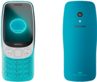
Nokia 3210 | Farbe: Kommunikation Scuba Blue