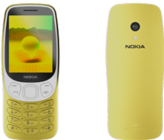
Nokia 3210 | Farbe: Kommunikation Y2K Gold