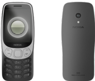
Nokia 3210 | Farbe: Kommunikation Grunge Black