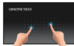
Touch Technologie - Kapazitiv

Dank des Android-Betriebssystems können Applikationen einfach installiert werden und der Bildschirm ganz flexibel Ihren Bedürfnissen angepasst werden.