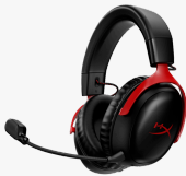
HyperX Cloud III Wireless - Gaming-Headset 77Z46AA