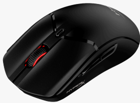
HyperX Pulsefire Haste 2 - Wireless-Gaming-Maus (Schwarz) 6N0B0AA