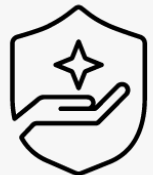
3 Jahre Abhol- und Rückgabeservice U1PS3E