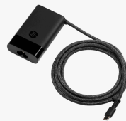
HP USB-C 65W Laptop Charger 671R2AA