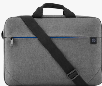
HP Prelude Laptop-Tasche (15,6 Zoll) 2Z8P4AA